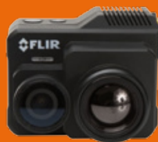
Flir Duo Pro R

RGB-Mapping Kamera mit 24.3 MP entspricht 6000 x 4000 px