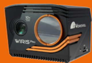
Workswell Wiris Pro - Dualkamera mit

RGB-Bild und Wärmebild im Wechsel 4000 x 3000 px und 640 x 512 px