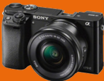
Sony Alpha 6000

RGB-Mapping Kamera mit 24.3 MP entspricht 6000 x 4000 px